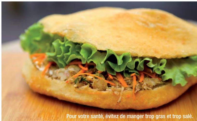
Pour votre santé, évitez de manger trop gras et trop salé.