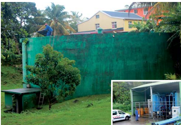
Captage de Gommier

Comme ces quatre captages sont sur des points hauts, la distribution de l'eau est due à gravité, limitant en cela l'utilisation de surpresseurs. Par contre, cette situation nécessite des appareils de régulation afin de maintenir un niveau acceptable de pression de l'eau.