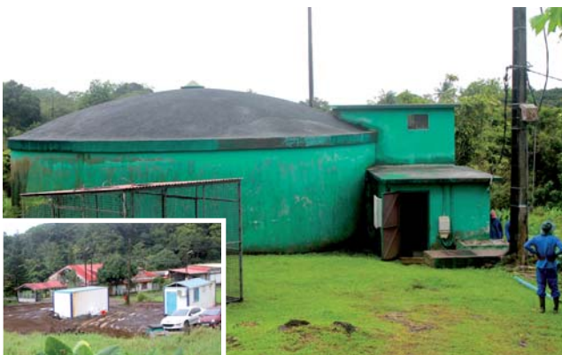
Captage de l'Hermitage et travaux du futur réservoir de 1500 m 3